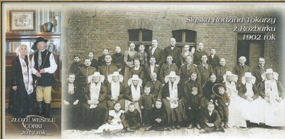
Śląska Rodzina Tokarzy z Rozbarku 1902 rok